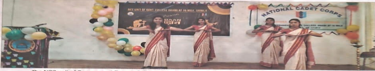
The NCC unit of Government Degree College, Dhami, celebrated NCC Foundation Day on Monday.