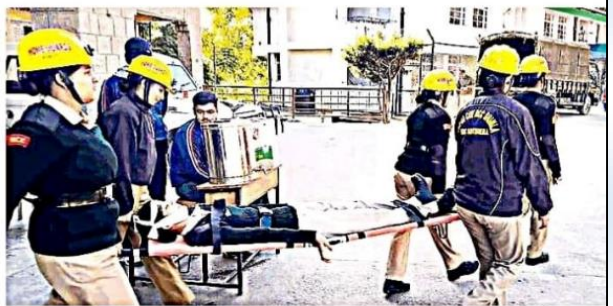
शिमला: राजकीय पाठशाला खलगा में दस दिवसीय युवा आपदा मित्र योजना शिविर में भाग लेती कैडेट्स।

धामी, 18 जनवरी (अखिनी) : राष्ट्रीय कैडेट कोर (एन.सी.सी.) की 7 एच.पी. (आई) कंपनी शिमला द्वारा 8 से 17 जनवरी तक राजकीय वरिष्ठ माध्यमिक विद्यालय खलगा में दस दिवसीय युवा आपदा मित्र योजना शिविर का आयोजन किया गया। शिविर में राजकीय महाविद्यालय धामी (16-मील), जिला शिमला हिमाचल प्रदेश के कुल 19 कैडेट्स ने भाग लिया। एन.सी.सी. की 7