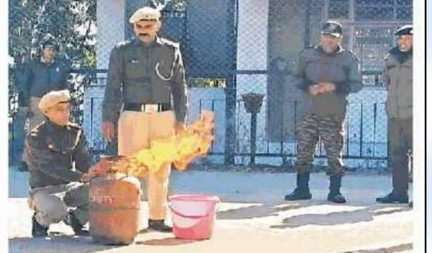
खलगा स्कूल में आग से बचाव के तरीके बताते जवान